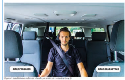
Figure 4 - installation en pilote de véhicule ; en amont du conducteur (rang 2)

nés se sont regroupés et ont chacun apporté leur expertise. La richesse des contributions et des échanges ont permis d'aboutir à une version synthétique d'une quinzaine de pages, couvrant l'ensemble des thématiques du cahier des charges initial.